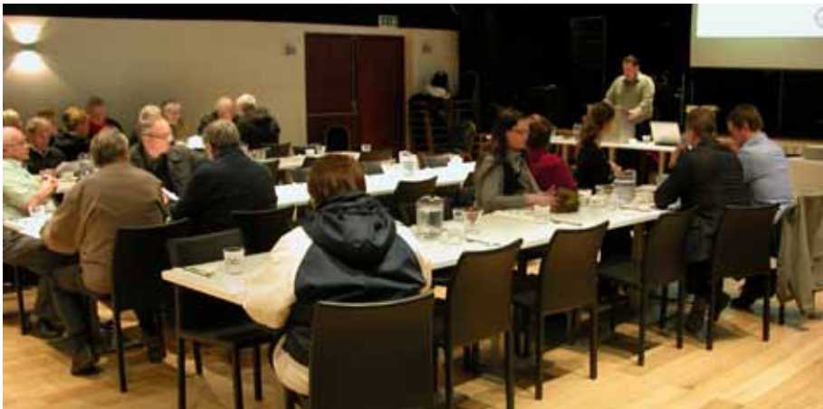
Aðalfundur Verkalýðsfélags Akraness var haldinn síðasta vetrardag, 21. apríl í Gamla Kaupfélaginu.

Fundarmenn lýstu yfir mikilli ánægju með starfsemi félagsins og gerir slíkt ekkert annað en að efla stjórnir og starfsmenn félagsins enn frekar til dáða.