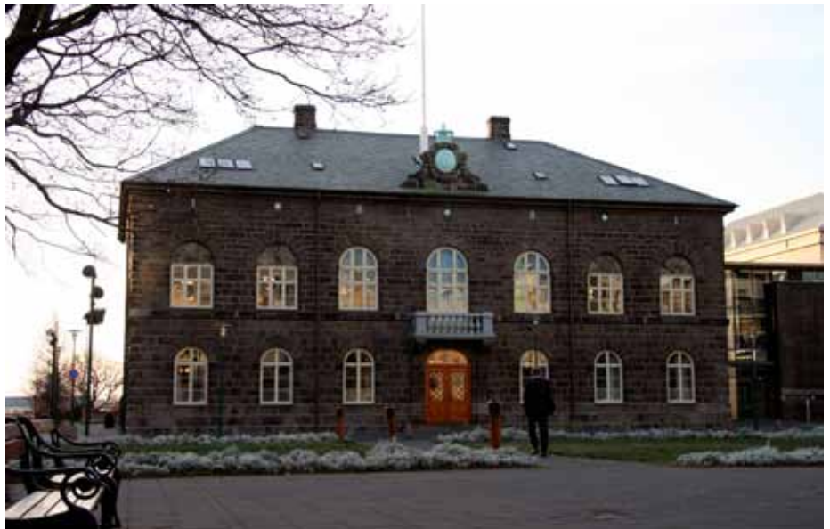
Alþingishúsið við Austurvöll.