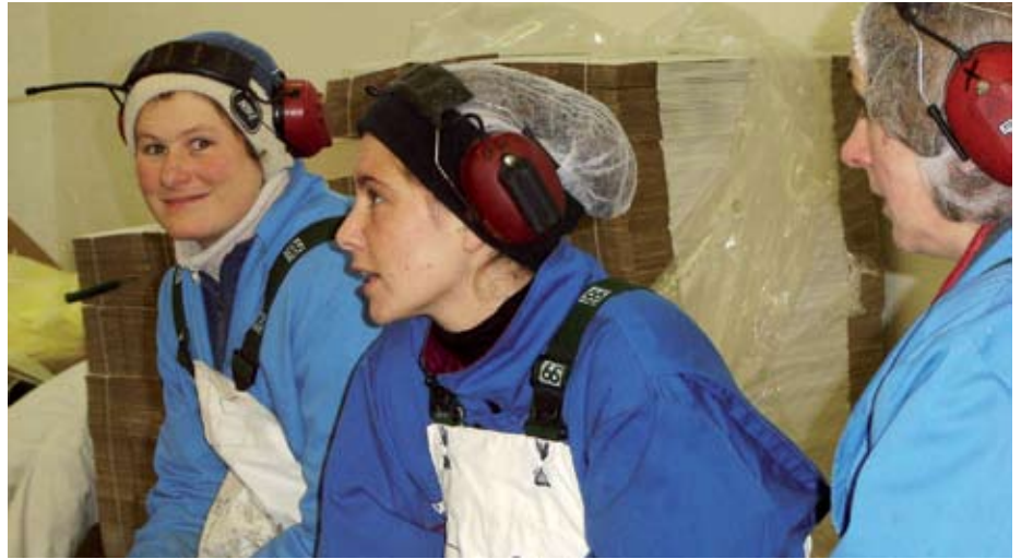
Félagsmönnum fjölgaði verulega á liðnu ári. Nýir félagsmenn eru 722 að tölu.

Í lok mars var gengið frá vinnustaðasamningi við Spöl. Samningurinn hefur sama gildistíma og kjarasamningurinn á hinum almenna vinnumarkaði eða til 30. nóvember 2010. Heildarhækkun launa starfsmanna gjaldskýlisins í nýjum samningi er um 32 þúsund krónur á mánuði. Einnig hækkuðu orlofs- og desemberuppbætur umtalsvert.