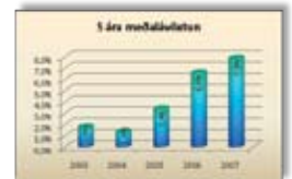
Meðaltal fimm ára raunávöxtunar