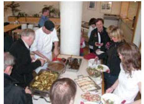
Stjórn félagsins bauð fundarmönnum upp á lambalæri með öllu tilheyrandi í lok aðalfundar.