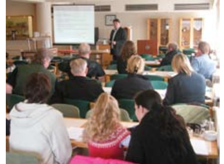
Aðalfundurinn var að þessu sinni haldinn í matstofu Fortuna í sal Sementsverksmiðjunnar.

Í skýrslu stjórnar kemur fram að hún er stolt yfir því hvernig til hefur tekist þau fjögur ár sem stjórnin hefur starfað. Samkvæmt könnun Capacent Gallup á síðasta ári eru yfir 90% félagsmanna ánægðir með það sem félagið hefur upp á að bjóða. Stórbætt afkoma félagsins og aukin þjónusta hefur skilað því þessum árangri. Markmið núverandi stjórnar er að Verkalýðsfélag Akraness verði það stéttarfélag sem mest og best þjónar sínum félagsmönnum hér á landi.