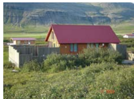
Bláskógar 12 Svínadal.

Stjórn orlofssjóds hefur kappkostað á undanförunum árum að sinna eðlilegu viðhaldi og umbótum orlofshúsa félagsins. Nú standa yfir stórframkvæmdir í bústöðum félagsins í Svínadal og Hraunborgum þar sem skipt verður um eldhúsinnréttingar og gólfefni. Vonast er til að framkvæmdum ljúki fljótlega. Síðastliðið sumar var samið við Björgunarfélag Akraness um að mála bústaði félagsins og voru húsin í Svínadal og Húsafelli máluð og pallarnir lakkaðir.