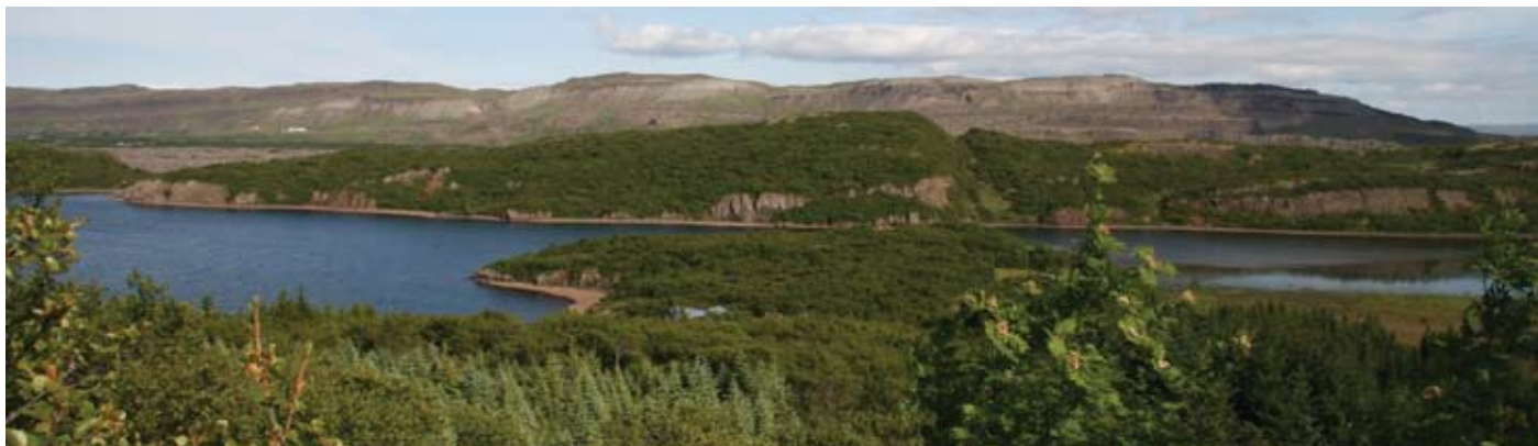
Náttúrufegurð Borgarfjarðar er rómuð. Myndin er frá Hreðavatni.

Í sumar verður sem fyrr boðið upp á dvöl í orlofshúsum félagsins í Húsafelli, Svínadal, Hraunborgum, Ölfusborgum og í þremur íbúðum á Akureyri.