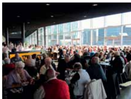
Hópurinn að snæðingi á Munnhörpunni

Næsti viðkomustaður var Höfði þar sem ferðafólk teygði úr sér í góða veðrinu og skoðaði þetta virðulega og sögulega hús, en búið er að setja upplýsingaskilti